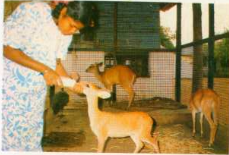
आरती हिरन के बच्चे को बोतल से दूध पिलाते हुए।